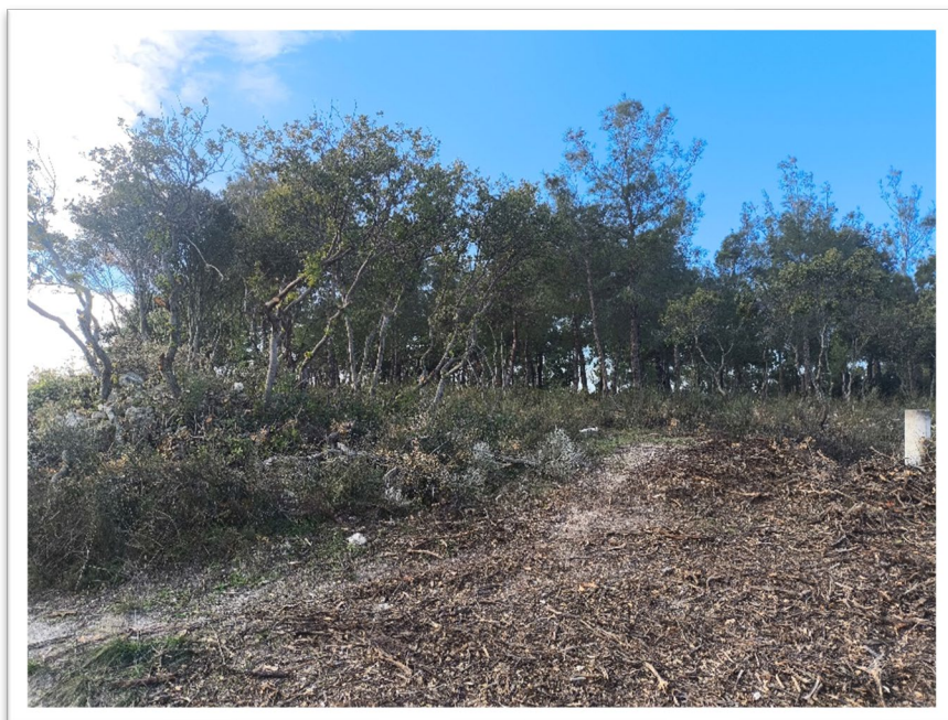
Εικόνα 1. Νέα Γωνιά – Κλάδευση και Διαχείριση βιομάζας (θρυμματισμός)