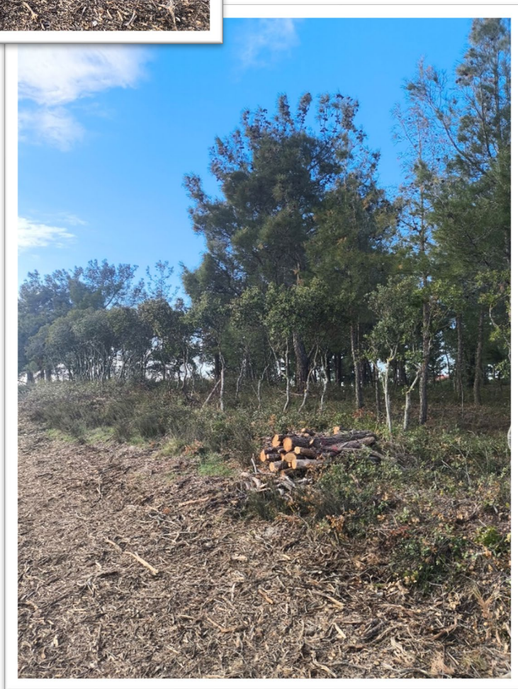
Εικόνα 2. Νέα Γωνιά – Κλάδευση και Διαχείριση βιομάζας (στοίβαξη και θρυμματισμός)