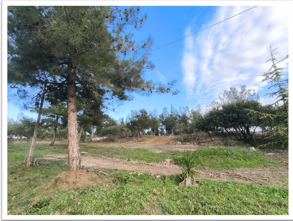
Εικόνα 5. Νέα Γωνιά – Άποψη του χώρου