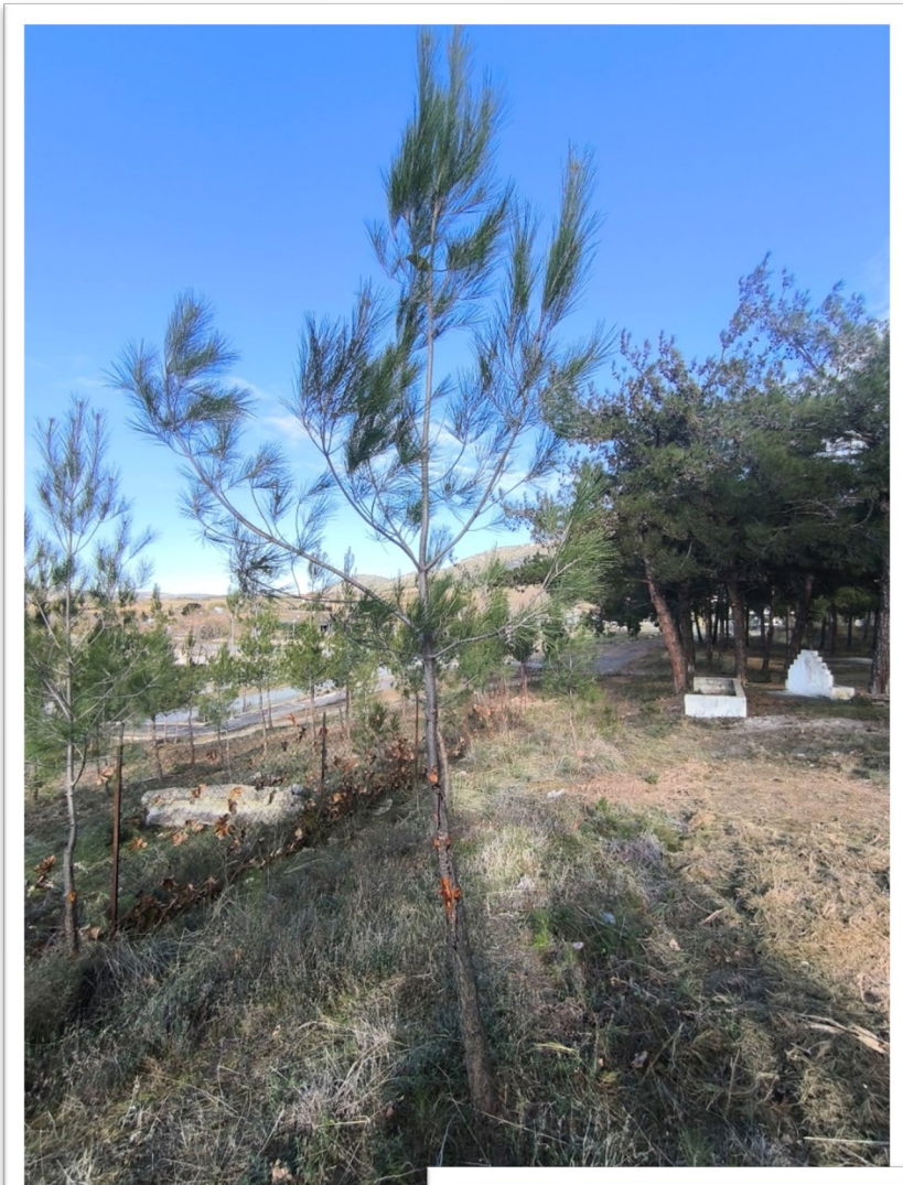
Εικόνα 11. Πετράλωνα - Κλάδευση δένδρων