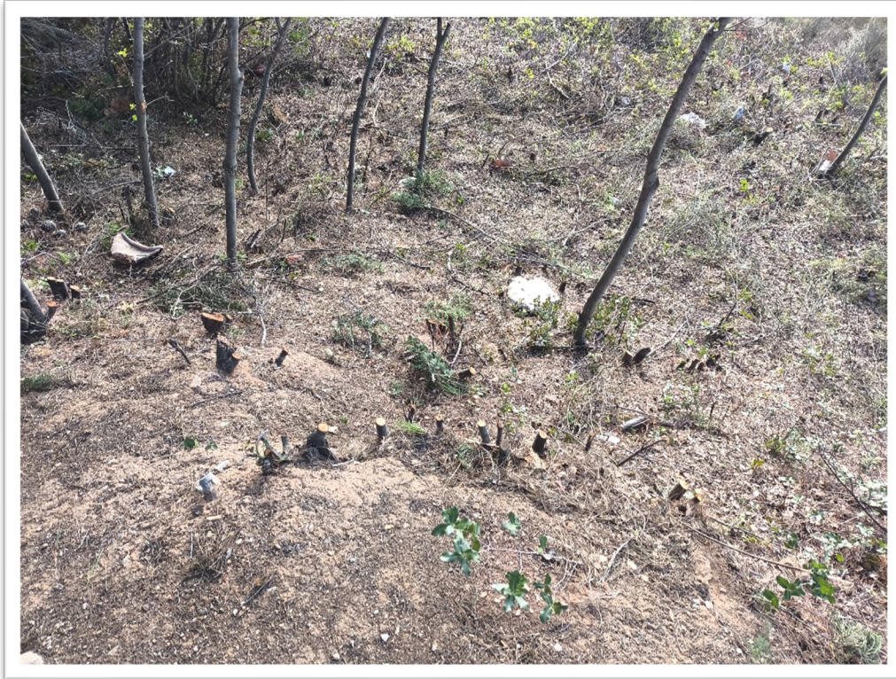
Εικόνα 13. Πετράλωνα - Κλάδευση και Καθαρισμός υπορόφου