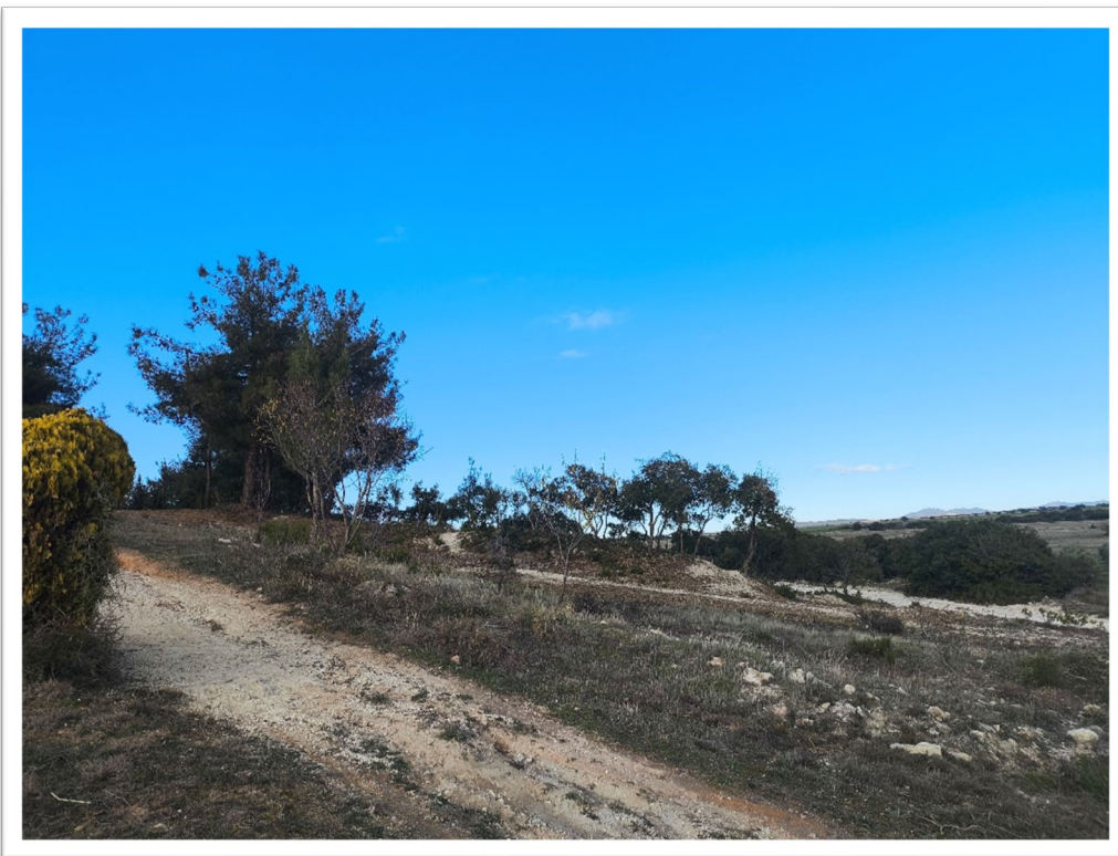
Εικόνα 8. Νέα Γωνιά – Κλάδευση, Καθαρισμός υπορόφου και Διαχείριση της βιομάζας (θρυμματισμός)