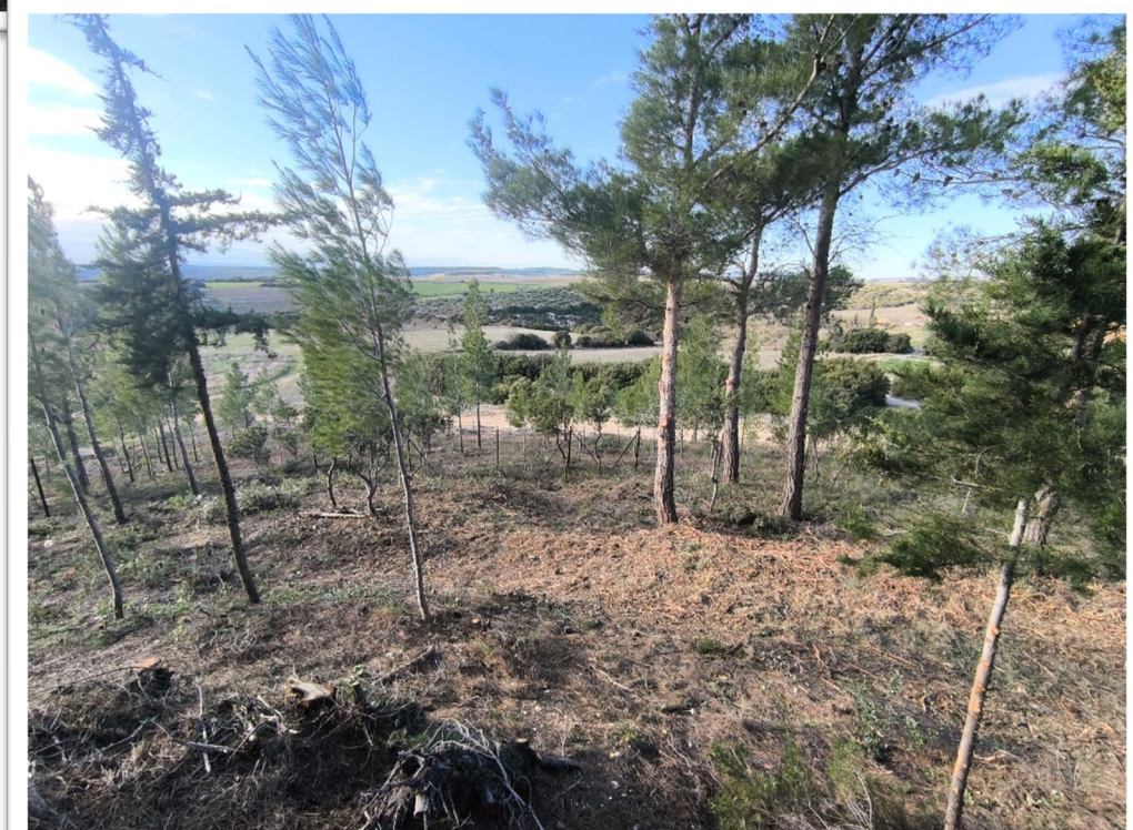
Εικόνα 12. Πετράλωνα - Κλάδευση δένδρων, Καθαρισμός υπορόφου και Διαχείριση βιομάζας (Θρυμματισμός)