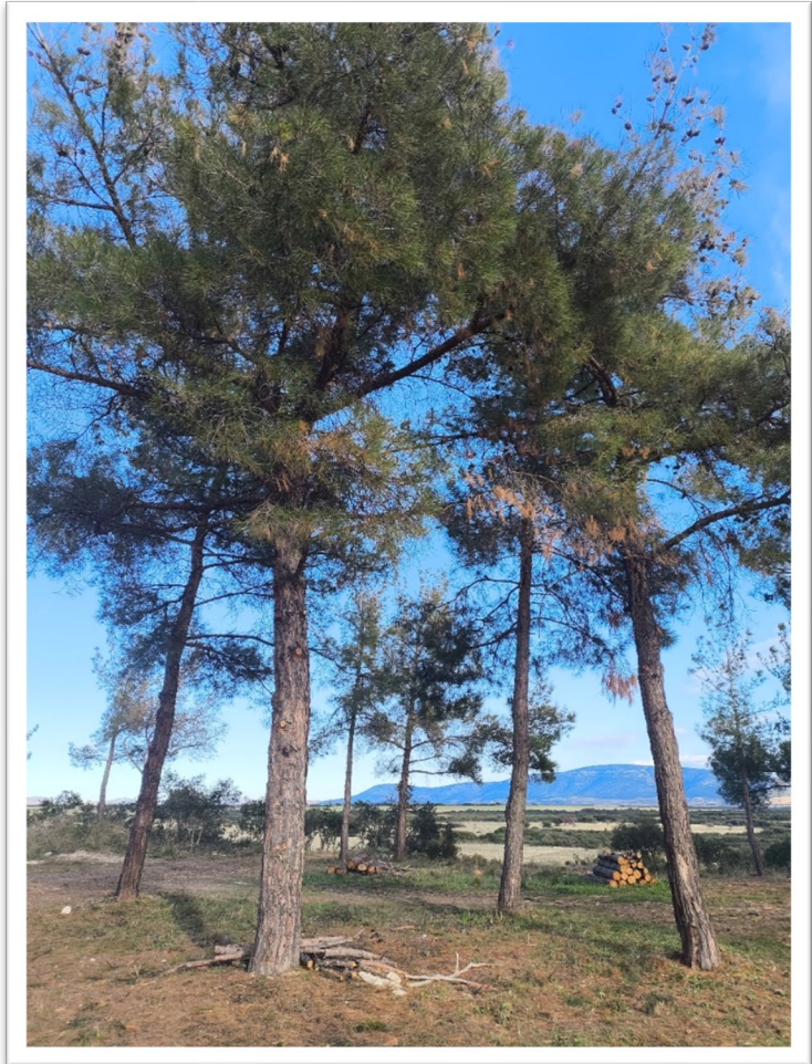
Εικόνα 6. Νέα Γωνιά – Κλάδευση και Διαχείριση βιομάζας (στοίβαξη)