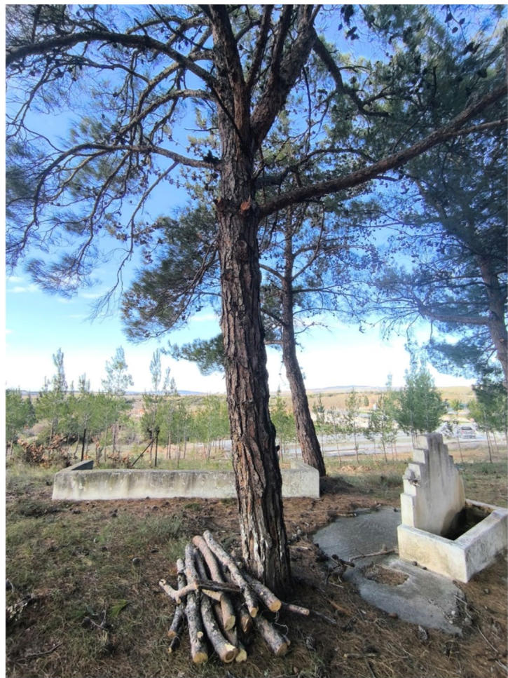
Εικόνα 9. Πετράλωνα - Κλάδευση και διαχείριση βιομάζας (στοίβαξη)