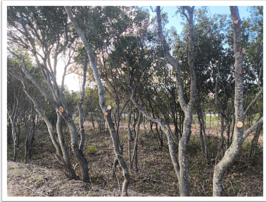
Εικόνα 4. Νέα Γωνιά – Κλάδευση και Καθαρισμός υπορόφου