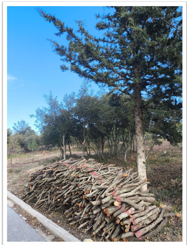
Εικόνα 3. Νέα Γωνιά – Κλάδευση και Διαχείριση βιομάζας (στοίβαξη)