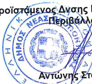
Αντώνης Σταματίου Ηλεκτρολόγος Μηχανικός ΤΕ

Ο Προϊστάμενος Δνσης Ποιότητας Ζωής, και Περιβάλλοντος