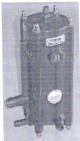
Εικόνα 7α. Φωτογραφία του βασικού ελεγκτή KPS AV75

Ενδεικτικός τύπος είναι ο ελεγκτής στάθμης λυμάτων της RoeVac, ο οποίος είναι κατασκευασμένος από πολυαμίδιο ενισχυμένο με ίνες υάλου (fiberglass) και αναρτάται πάνω στο σώμα της βαλβίδας με τη βοήθεια ολισθαίνουσας σύνδεσης (συρταρωτά). Οι σωληνώσεις κενού συνδέονται στη βαλβίδα.