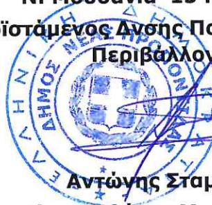
Αντώνης Σταματίου Ηλεκτρολόγος Μηχανικός ΤΕ

Ν. Μουδανιά 15 . 04 . 2025 Ο Προϊστάμενος Δνσης Ποιότητας Ζωής, και Περιβάλλοντος