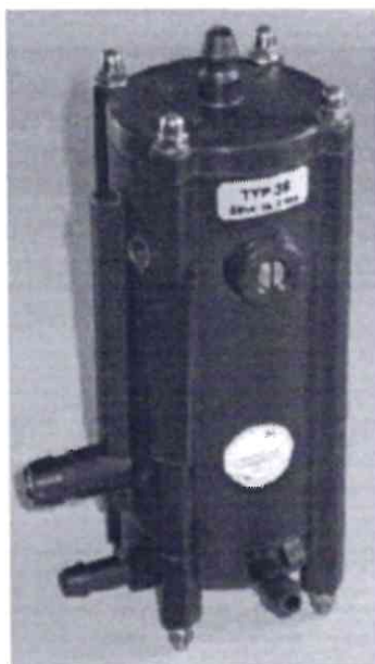
Εικόνα 7α. Φωτογραφία του βασικού ελεγκτή KPS AV75