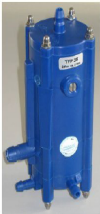
Εικόνα 7α. Φωτογραφία του βασικού ελεγκτή KPS AV75

Ενδεικτικός τύπος είναι ο ελεγκτής στάθμης λυμάτων της RoeVac, ο οποίος είναι κατασκευασμένος από πολυαμίδιο ενισχυμένο με ίνες υάλου (fiberglass) και αναρτάται πάνω στο σώμα της βαλβίδας με τη βοήθεια ολισθαίνουσας σύνδεσης (συρταρωτά). Οι σωληνώσεις κενού συνδέονται στη βαλβίδα.