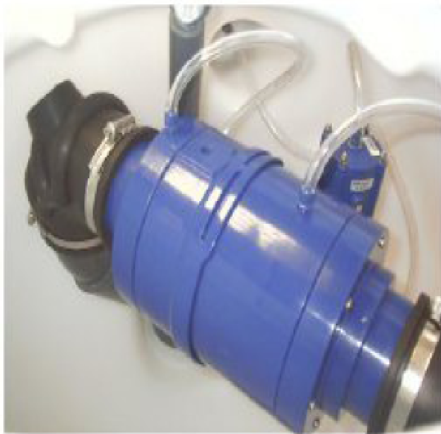
Εικόνα 4. Μονάδα βαλβίδας κενού 75 mm (3") εγκατεστημένη στον ξηρό θάλαμο φρεατίου

Η μέγιστη παροχή φόρτισης που επιτρέπεται ανά βαλβίδα, εξαρτάται από το μέγεθος της βαλβίδας για Φ 2,5". παροχή αιχμής 0,20 l/s, η οποία ενδεικτικά αντιστοιχεί σε 40 ισοδύναμους κατοίκους (PE) με εκτιμώμενη ημερήσια απορροή 180 lt/day/PE και συντελεστή αιχμής 2,4.